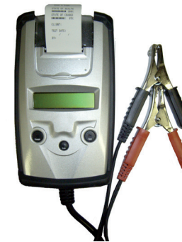
Batterietestgerät Mawek MBT 301379 mit Drucker, Aktionspreis

Testen Sie bei jedem Fahrzeug die Batterie. Sie erhöhen Ihre Verkaufschancen, der Kunde dankt es Ihnen!