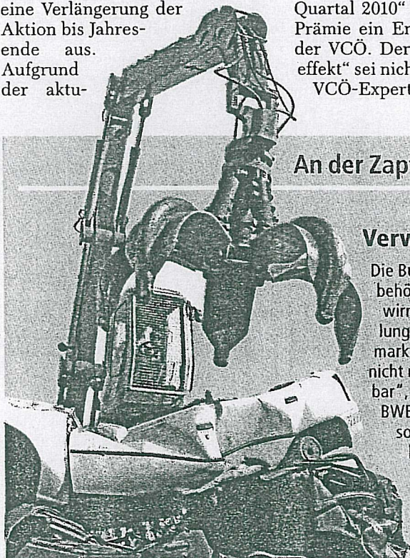
An der Zapfsäule